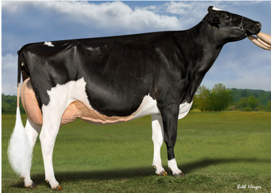
S-S-I DOC HAVE NOT 8784 GRANDDAM