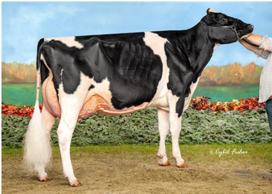
S-S-I DOC HAVE NOT 8783 FULL SISTER TO GRANDDAM